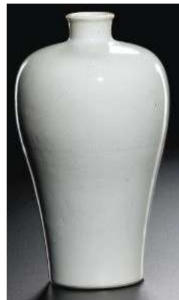
Vase meiping en porcelaine monochrome blanc, Chine, dynastie Qing, XIXe siècle

Cet objet évoque la Chine par sa forme et son apparence. Il reprend la silhouette d'un vase traditionnel chinois , avec des formes arrondies et empilées. L'aspect blanc, lisse et brillant rappelle celui de la porcelaine , même si l'objet est en réalité fabriqué en matière plastique .