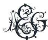
Franz Schwechten (1896)